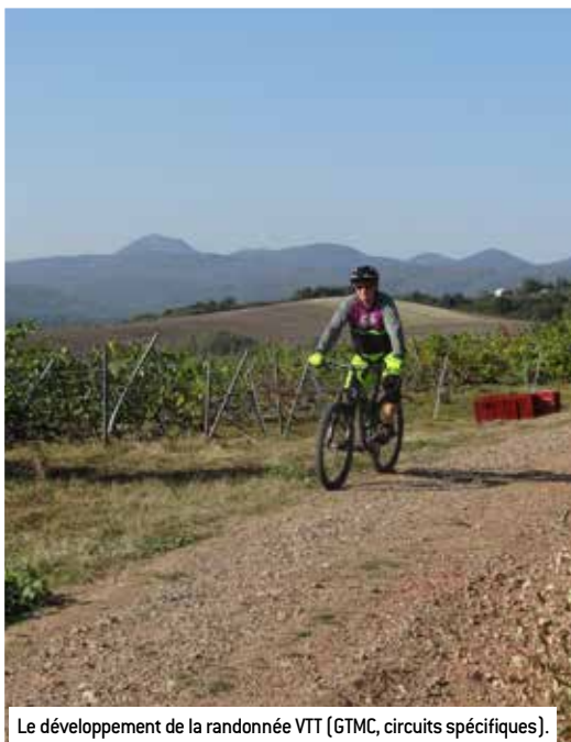
Le développement de la randonnée VTT (GTMC, circuits spécifiques).