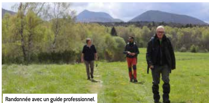
Randonnée avec un guide professionnel.

Pour la randonnée touristique ou les déplacements quotidiens non motorisés, Riom Limagne et Volcans a choisi de développer des chemins balisés sur l'ensemble du territoire.