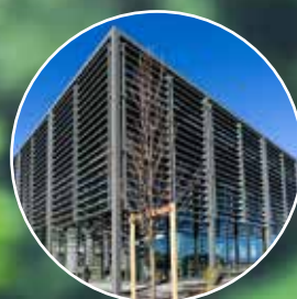
Le succès de la nouvelle Médiathèque des Jardins de la Culture