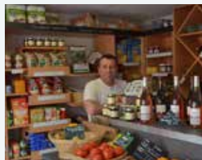
BOULANGERIE-ÉPICERIE Patrick Jarrix

33 rue de l'Hôtel-de-Ville 63200 Riom 09 67 17 00 47 www.lafeemaraboutee.fr/la-fee-maraboutee-riom-893.html