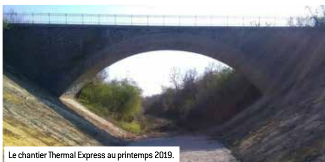
Le chantier Thermal Express au printemps 2019.