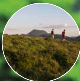
Destination Terra Volcana